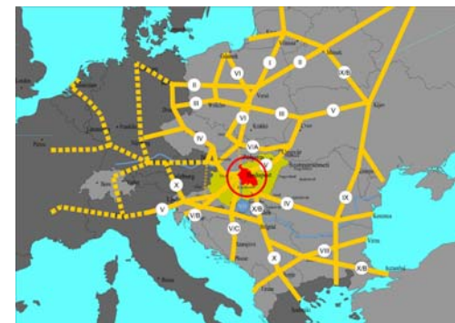
A pán-európai közlekedési folyosók