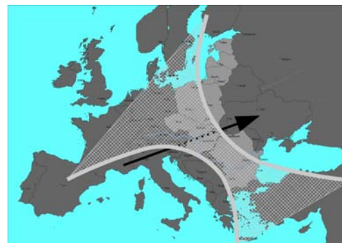
Európai térségfejlődési tendenciák